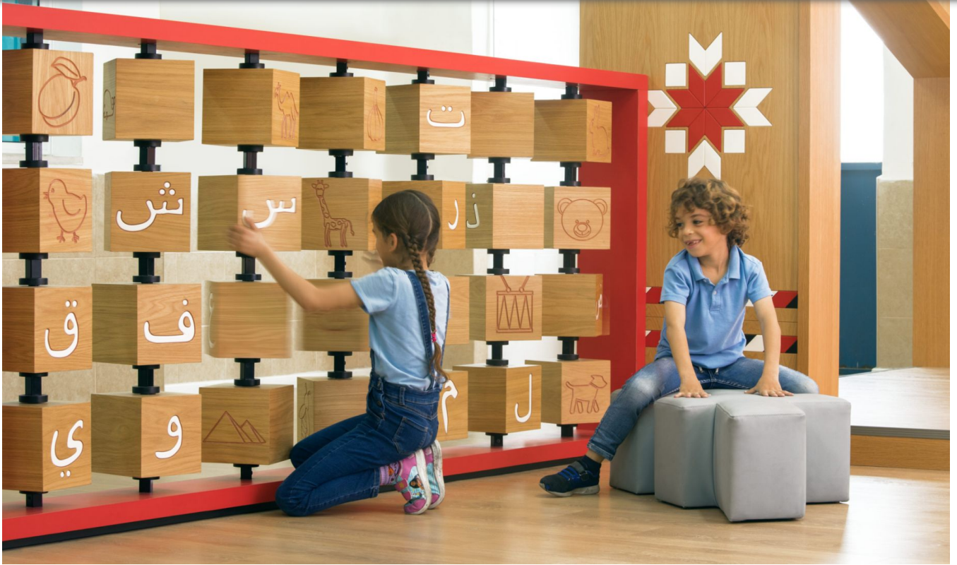
מחיצת קוביות עץ מסתובבות, שעל צדן האחד חרוטה אות בערבית ועל הצד אחר ציור של מלה המתחילה באותו אות