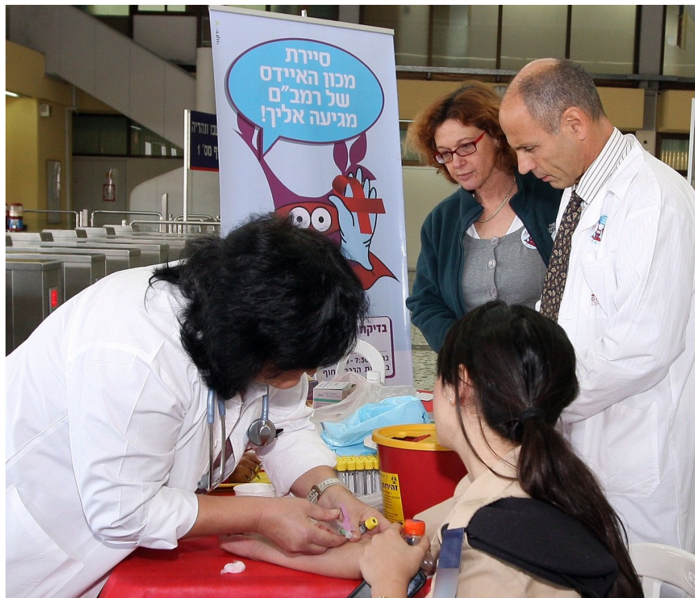
בדיקת דם ברמב"ם (למצולמים אין קשר לנאמר).

בדיקת הדם שמבקשים החוקרים לפתח אמורה להתבסס על פרופיל מטבולי, ולשם כך ערכו החוקרים מחקר ארוך-טווח שממצאיו פורסמו לאחרונה בכתב העת המדעי Nature Communications. מדובר במחקר הרחב ביותר מסוגו שנעשה עד כה, והוא מסתמך על נתונים של יותר מ-44 אלף נחקרים, מגיל 18 עד 109. כ-5,500 מהם נפטרו במהלך המעקב. מטרת המחקר הייתה לאתר סמנים ביולוגיים (ביומרקרים) בדם העשויים לסייע במינוף הנושא.